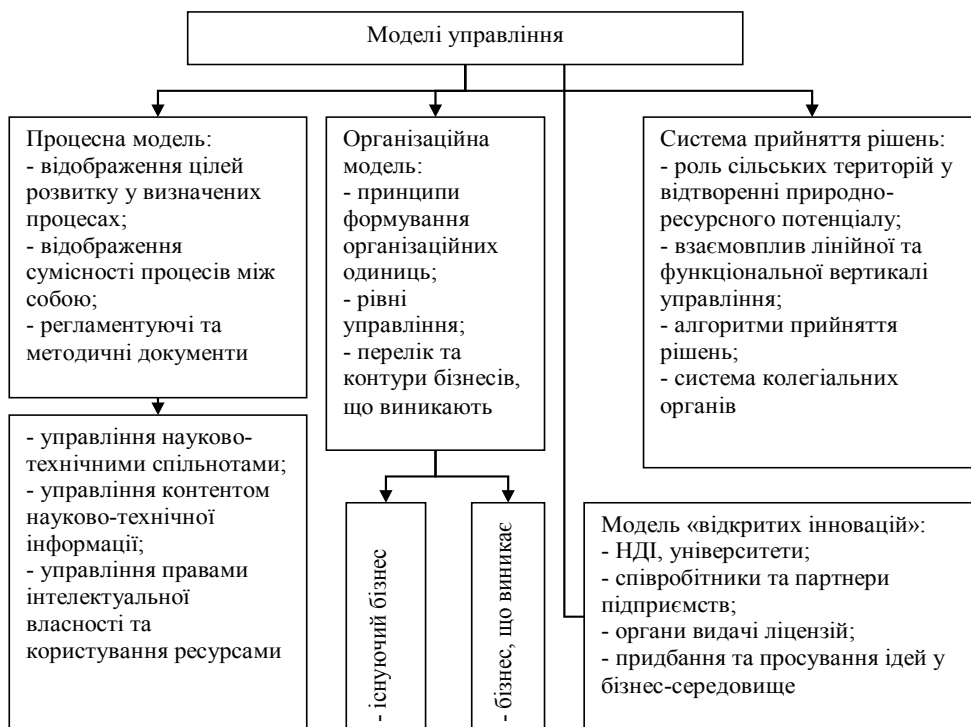
Рис. 2. Базові моделі управління підприємництвом на сільських територіях