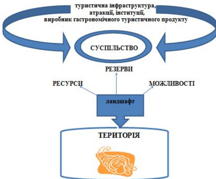
Рис. 4. Структура гастрономічного потенціалу території за І. К. Нестерчук

І зазвичай, враження, від гастрономічних смаколиків сильніше, ніж від побачених красот і визначних пам'яток. Саме тому гастрономія, і ресторанный бізнес, стають останнім часом двигуном розвитку гастрономічного туризму – «магнітом», який притягує внутрішніх і іноземних туристів. Регіональна кухня, автентичні продукти харчування – це світовий тренд в кулінарії і туризмі, який розвивається і в Україні. Їстівні сувеніри з регіонів везуть більше і частіше, ніж магніти або тарілки. Правобережне Полісся, очевидно є саме тією територією з великим гастрономічним потенціалом, як в стравах, так і в подієвій складовій. Отже, гастрономічний потенціал – це симбіоз ресурсу (туристично-рекреаційних), резерву (використання та практичне втілення притаманних здібностей: кулінарних, готельно-ресторанних, інституційних), можливостей (формування нових навиків: кулінарні школи, майстер-класи, блоги, тури, нав'язування нової моделі відпочинку масмедіа), туристичної інфраструктури, виробника гастрономічного туристичного продукту, інституцій, атракцій для організації та здійснення туристичної, рекреаційної, гастрономічної, готельно-ресторанної, логістичної, промоційної діяльності в регіоні з метою задоволення потреб людини (Авт. – Н. І.). (рис. 4).