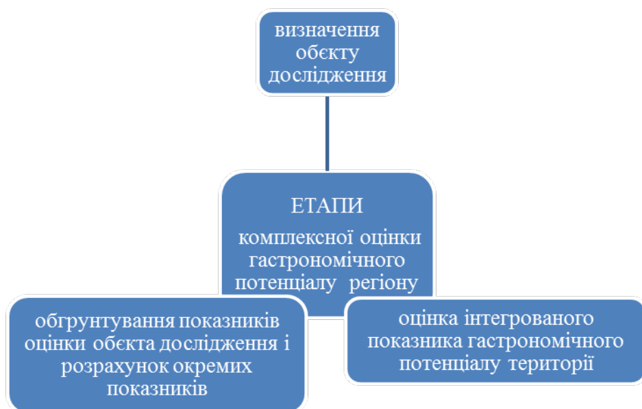
Рис. 3. Алгоритм методики гастрономічного потенціалу регіону

Алгоритм визначення гастрономічного потенціалу на регіональному рівні підпорядкований авторській методиці, яка складається з дослідницьких етапів (рис. 3).