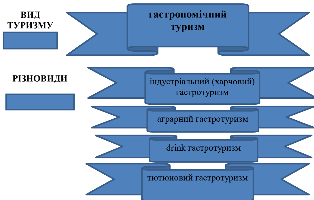
Рис. 2. Різновиди гастрономічного туризму

Різновид індустріальний (харчовий) гастротуризм включає переробку їжі тваринного (продукти харчування м'ясні, рибні, морепродукти, молоко та молочні вироби, яйця, жирові продукти) та рослинного (овочі, фрукти, зернові, бобові, горіхи, мак, олія, гриби) походження.