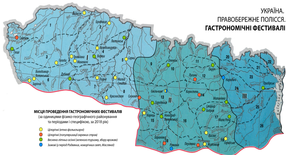
Рис. 5. Картосхема гастрономічних фестивалів Правобережного Полісся

Значний внесок у розвиток вчення про туристичні регіони внесли видатні вітчизняні дослідники О. Бейдик, О. Любіцева, серед зарубіжних Ю. Веденін, А. Даринський, Ю. Дмитрівська, В. Преображенський, І. Твердохлебов, Д. Ніколаєнко, Н. Мироненко, І. Зорін, В. Квартальнов, Е. Котляров, А. Александрова, Л. Мажар, Т. Ірисов і ін. Під туристично-рекреаційним районом розуміється структурно-організований простір, цілісна частина туристично-рекреаційного простору, що володіє індивідуальними ознаками привабливості і відрізняється специфікою туристично-рекреаційного, потенціалу, туристичних продуктів і послуг для рекреантів, туристів і підприємців. Нашим завданням є виділити в майбутньому: гастрономічно-туристичні регіони, гастрономічно-туристичні райони та провести гастрономічно-туристичне районування території Правобережного Полісся (рис. 5, 6), що буде зроблено у наступних наукових розвідках. На даному етапі ми провели візуалізацію гастрономічного потенціалу, фестивалів та ввели в науковий обіг його дефініцію.