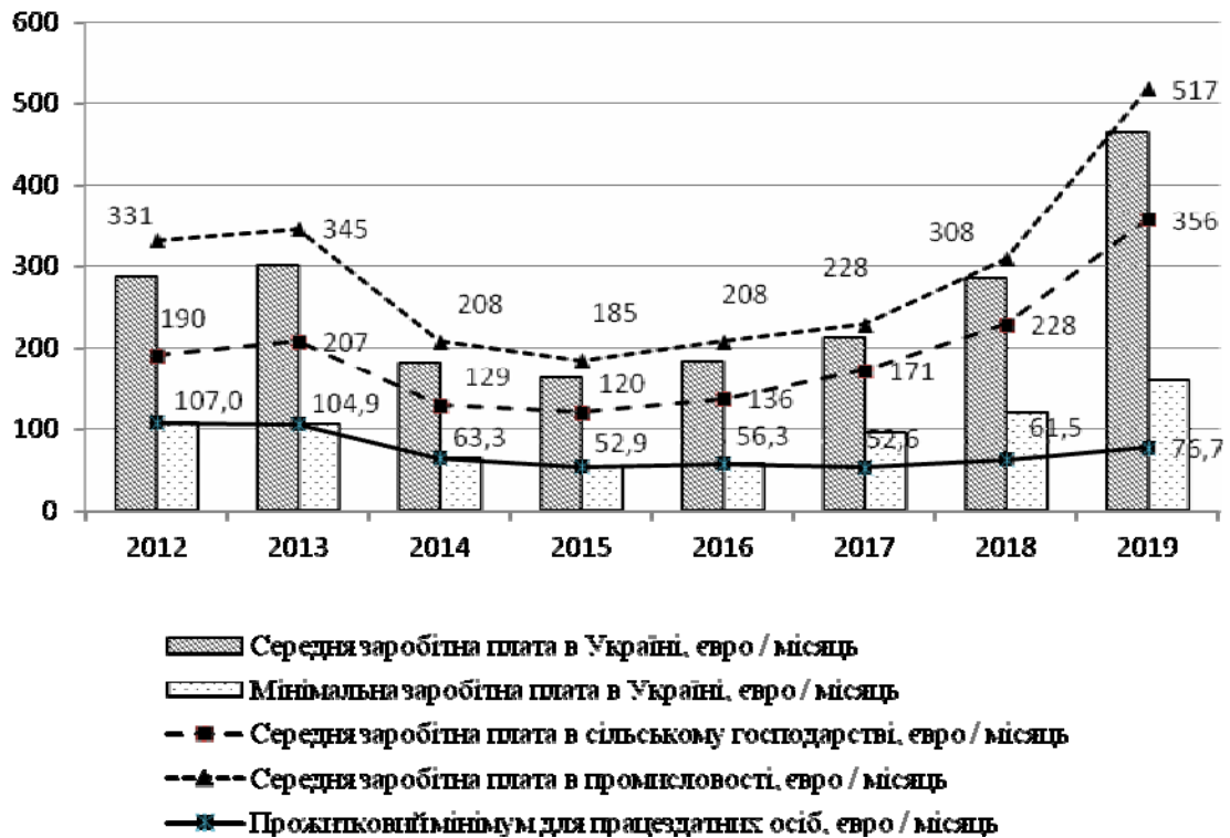
Рис. 1. Динаміка заробітної плати в сільському господарстві та промисловості порівняно з мінімальними державними гарантіями