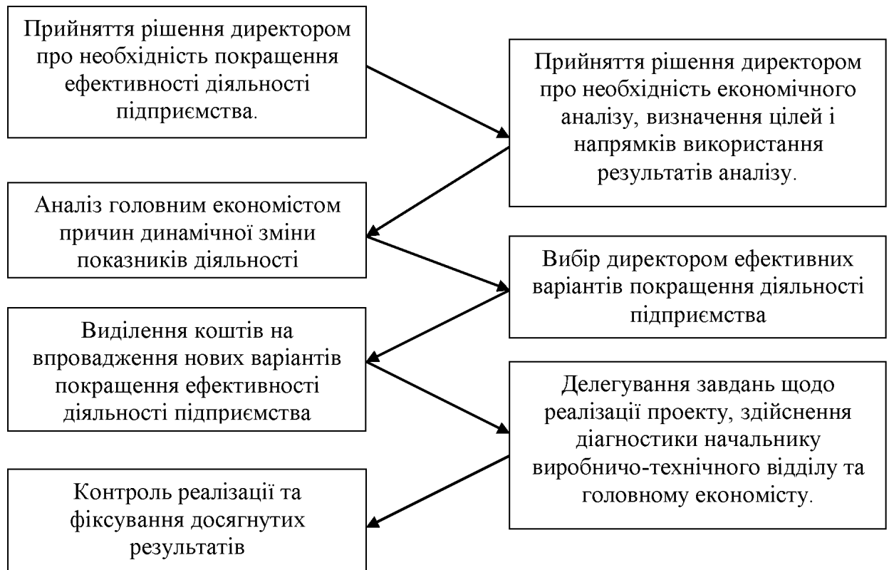
Рис. 3.2. Схема процесу прийняття рішення щодо реалізації аналізу і управління ефективністю діяльності ТОВ “Аленруд”

управління ефективністю діяльності ТОВ “Аленруд” представимо на рисунку 3.2.