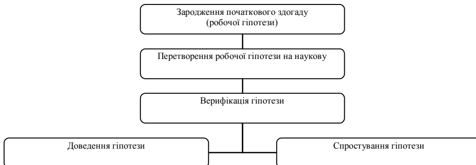
Рис. 2. Алгоритм формування гіпотези в економічному дослідженні

Зародження початкового здогаду є складним і суперечливим процесом освоєння інформації про відповідний фрагмент реальності, який часто має напівінтуїтивний характер. Логічні засоби, які використовують у цьому процесі, не завжди усвідомлюють, тому створюється видимість несподіваності виникнення здогаду. Історія економічної науки свідчить, що більшість гіпотез постала у процесі міркування за формою аналогії та неповної індукції, хоча цю роль можуть виконувати й інші форми умовиводів, які з певних причин не спроможні забезпечити достовірні висновки. Початковий здогад відрізняється від наукової гіпотези меншою обґрунтованістю, проте за умов дефіциту інформації про певний об'єкт іноді доводиться вдаватися до нього як єдино можливого засобу пояснити досліджувані явища, надати аналізу відповідних явищ упорядкованого цілеспрямованого характеру, систематизувати наявну інформацію. Тому здогад у його первісному вигляді часто використовують як робочу гіпотезу, яка, не претендуючи на статус готової відповіді на питання про природу явищ, дає можливість розпочати організований і цілеспрямований процес їх дослідження.