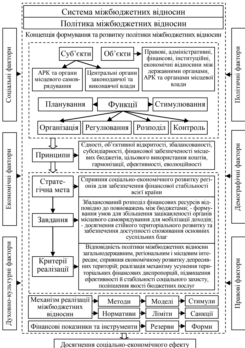
Рис. 5.3. Політика міжбюджетних відносин у державному регулюванні соціально-економічних процесів