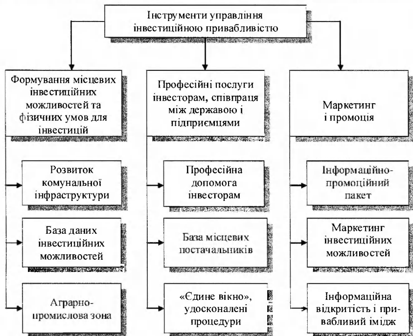
Рис. 3. Інструменти управління інвестиційною привабливістю АПК на регіональному рівні