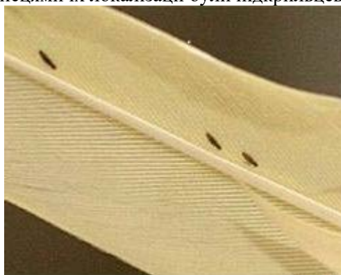
Фото 1. Малофаги на пері птаха

Ектопаразити, що належать до родин Anatoecus , Philopterus , здебільшого локалізувалися на голові та шиї, в той час як у представників родин Lipeurus , Anaticola типовими місцями їх локалізації були підкрильцеві області та спина.