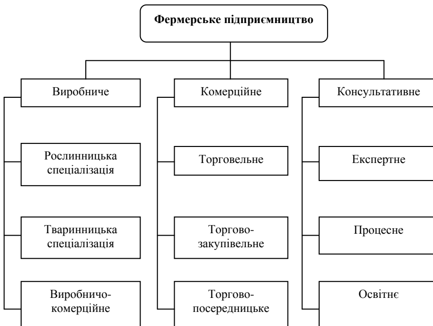
Рис. 1. Види фермерського підприємництва

Проте, система економічних відносин між суб'єктами фермерського підприємництва, яка виникає в процесі виробництва і доведення сільськогосподарської продукції до споживача, не у повній мірі розкриває його внутрішні властивості. Для обґрунтованої характеристики досліджуваної категорії слід усвідомити відношення зазначеного бізнесу до інших ринкових форм. Взаємозалежність фермерського підприємництва і агробізнесу підкреслює об'єктивний характер товарно-грошових відносин, відображає суспільно-історичне явище. Звідси агробізнес можна ототожнювати з новою формою міжгосподарських зв'язків, які встановлюються для задоволення індивідуальних потреб у продукції сільського господарства, і ставити знак рівності між агробізнесом і фермерським підприємництвом.