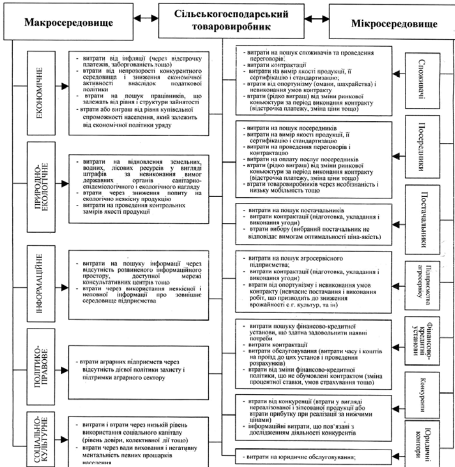
Рис. 3. Модель формування транзакційних витрат в агробізнесі

метою дослідження складу транзакційних витрат аграрних підприємств необхідно дослідити різноманітність зв'язків, що поєднують агробізнес в єдину структуру на мікрорівні і розглянути макросередовище агробізнесу в цілому. Основою аграрного сектору економіки є сільськогосподарський товаровиробник, тому його прийнято за відправну точку дослідження. В результаті його взаємовідносин з елементами мікро- і макросередовища формуються транзакційні витрати, що узагальнено на рисунку 3.