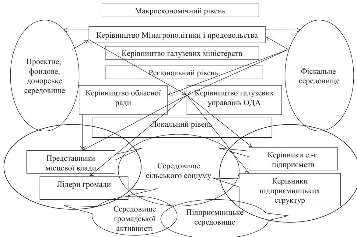
Рис. 1. Середовище сільського соціуму як локальний об'єкт координації соціально-економічного розвитку