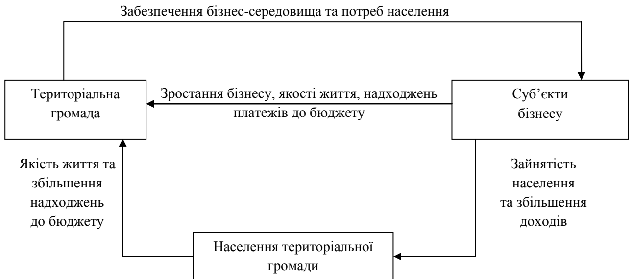
Рис. 1. Роль бізнесу в розвитку територіальних громад