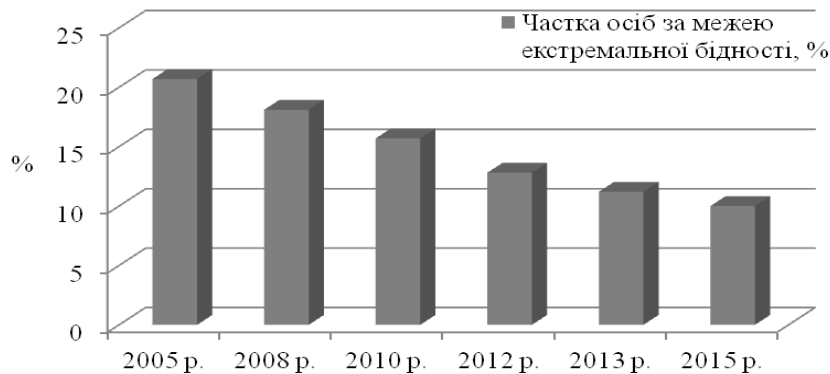
Рис. 2. Рівень екстремальної бідності у світі, 2005–2015 рр.

близько 750 млн осіб вважаються бідними, з них 80 % проживають у сільській місцевості.