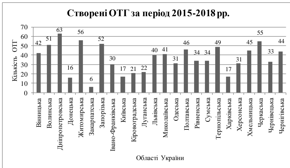
Рис. 1. Рейтинг областей України щодо формування ОТГ

Доходи бюджетів охоплюють дві важливі складові: доходи загального фонду і доходи спеціального фонду бюджету. Загальний фонд акумулює кошти, які мають загальнодержавний характер і в подальшому перерозподіляються. У спеціальному фонді зосереджуються кошти бюджетних установ, у тому числі спеціальні державні цільові фонди, які не підлягають перерозподілу і використовуються за цільовим призначенням [1].